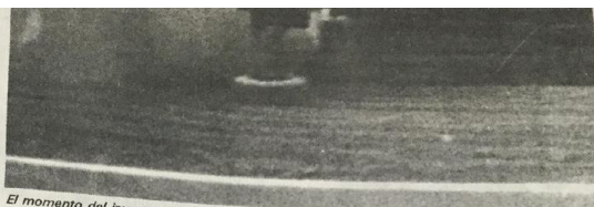
El momento del impacto del McLaren de Senna contra las llantas de contención.

que sus mecánicos tienen la posibilidad de corregir las partes averiadas y dejar el coche listo esta tarde para las pruebas que darán la salida para la carrera preliminar al Gran Premio de México.