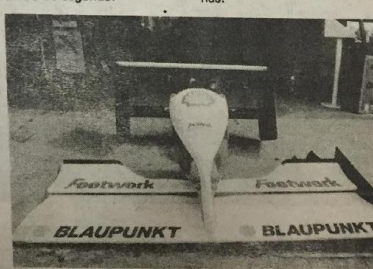
en la fórmula Uno: en ciencia y tecnología. La trompa de tiburón del Benetton, las alas de gaviota del Tyrrell —enmedio— y una especie de quilla del Footwork.

El refinamiento tecnológico en la Fórmula Uno no se limita sólo a los diseños, sino también a los motores, y la marca Honda es ejemplo al utilizar la telemetría, un sistema de telecomunicación computarizada vía satélite, que permite realizar cambios al motor — incluso en carrera —, desde la sede de la fábrica en Japón, en apenas décimas de segundo.